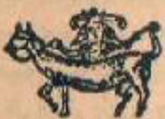
وهو برج الحمل والمريخ وهو ناري قل الحكيم فيه شرا

وصاحب الحمل ناري وان له عند الملوك مقاما صادقا بهل هريغ كوكبه والشرف طالعه والسعد يتقدمه في السبل والحمل ذو صورة ظهرت من عظم منه معارف نشأت من خالق الأزل قال أبو مضر المولود بهذا البرج يكون رجلا أسمر اللون طويل القامة